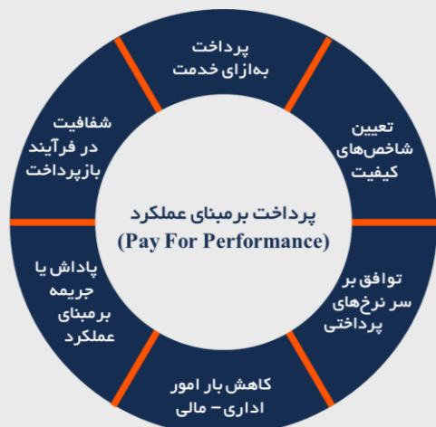
شکل ۲: مولفه‌های پرداخت بر مبنای عملکرد

وجود قوانین سخت‌گیرانه و نبود حمایت مالی کافی از سوی بیمه‌ها، فشار زیادی را بر جامعه پزشکی تحمیل کرده است. تأخیر مکرر و طولانی بیمه‌ها در پرداخت‌ها و عدم احتساب جریمه برای این تأخیرها در شرایط تورمی، کاهش شدید ارزش واقعی دستمزد پزشکان را به همراه دارد. از سویی دیگر، نظارت ناکافی بیمه‌ها بر تجویزهای بی‌رویه و خدمات غیرضروری، هدررفت بخش قابل‌توجهی از بودجه سلامت و عدم تامین هزینه‌های واقعی درمان را به دنبال دارد. به نظر می‌رسد اصلاح نظام بیمه‌ای، اقدامی موثر در ارتقا کیفیت خدمات درمانی و حمایت از جامعه پزشکی باشد.